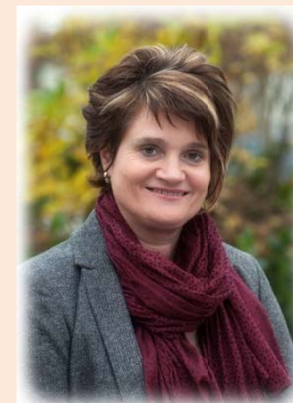
Dir. Ludmilla Lumesberger

Unsere Schule bietet eine zielorientierte Ausbildung für jene Schüler/innen, die nach der allgemeinen Schulpflicht einen Beruf erlernen wollen.